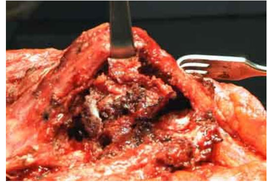
Stan po usunięciu trzonów worek uniesiony do góry