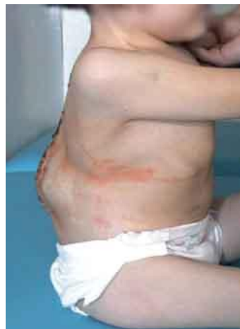
Sylwetka pacjentki po operacji i kontrolne rtg