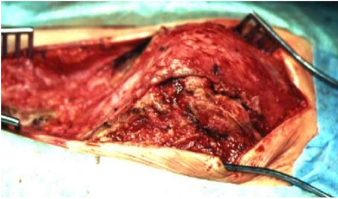
Worek oponowy i garb kręgowy po odpreparowaniu